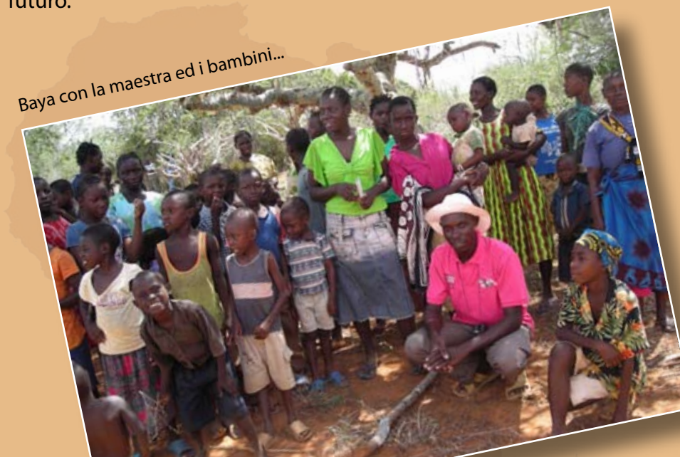
Baya con la maestra ed i bambini...

Ci hanno accolti cantando un inno di benvenuto, nei loro occhi si vedeva una grande dignità, ma anche la paura del futuro.