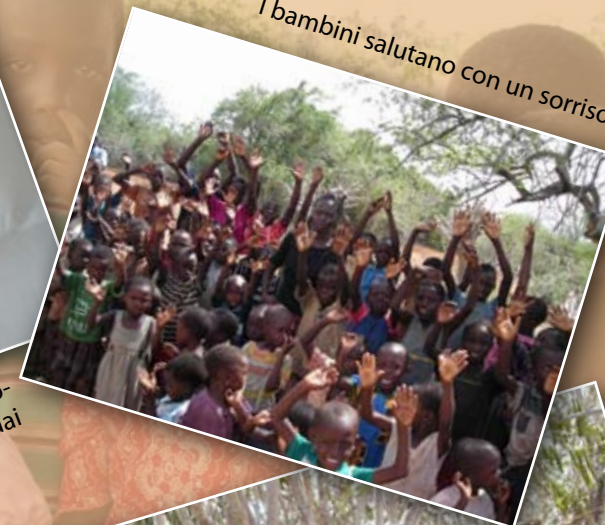
I bambini salutano con un sorriso...